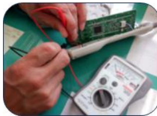
〈ベッドリモコン修理〉