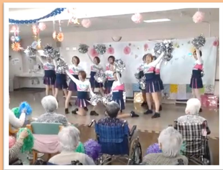
チア・リーディング (上越シャイニング☆スマイルさん)