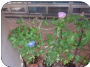
〈エントランスの朝顔〉

特に今年の夏は暑い日が続き、日差しが強い所には遮光ネットを取り付けたり、正面玄関エントランスに朝顔を設置して、涼しさを感じてもらえるような工夫もしています。