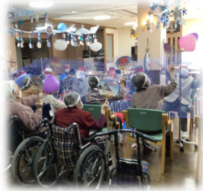
バレンタインお楽しみ会 （ハートの風船でバレー）