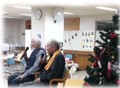
忘年会（利用者の歌唱）