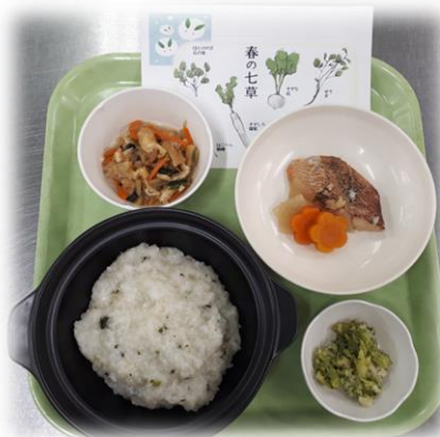
お正月「春の七草がゆ」