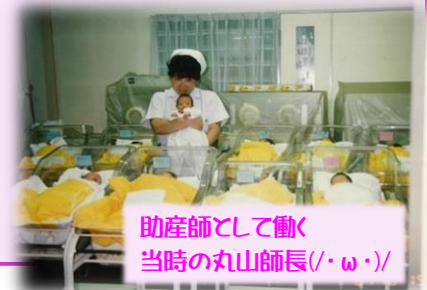
助産師として働く 当時の丸山師長(・ω・)/